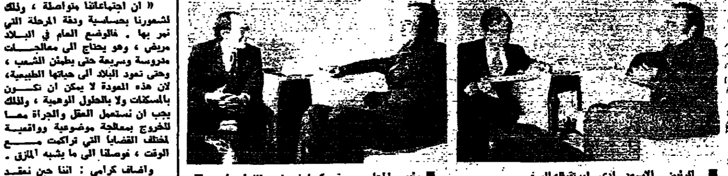
رئيس المجلس وسفير كوبا في مجلس النواب امس

جلس التولي من القيام بدوره على صعيد المراتبة، وعلى صعيد التصريح وقال الرئيس الاسعد ان لقاءه مع الرئيس كراي ومن ثم مع الرئيس صائب سلام، وقياسي مع نطق هذا التصريح، وكلمة للمشاريع التي يجريها مع النواب ومع جميع المسؤولين، والتي تتناول الأوضاع الراهنة. وقال الاسعد: وأبلغ الاسعد النواب انه ما زال